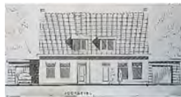
Bouwtekening (S.D.)