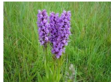
Foto Rietorchis