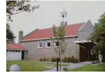
foto kerkje Sir op oude postkaart, datum & maker onbekend

In maart dit jaar hebben we de openbare vergadering van de DR bijgewoond en we zijn van plan dat vaker te doen, het was nuttig en gezellig. We willen nog eens benadrukken dat we altijd bereid zijn om mee te denken over de gang van zaken rondom de kerkdiensten en het gebruik van de kerk doordeweeks! Volgens de informatie op www.zalig-zeeland.com was er waarschijnlijk al in de 14 e eeuw een kerkje op Sir. Dus zachtjesaan zullen we aan elkaar gewend zijn.